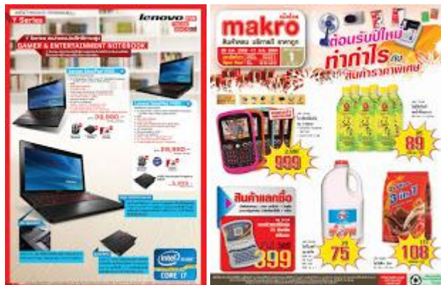
รูปที่ ๑.๖ รูปสื่อประเภทสิ่งพิมพ์โฆษณา

๑) โบชัวร์ (Brochure) เป็นสื่อสิ่งพิมพ์ที่มีลักษณะเป็นสมุดเล่มเล็ก ๆ เย็บติดกันเป็นเล่มจำนวน ๘ หน้า เป็นอย่างน้อยมีปกหน้า และปกหลัง ซึ่งในการแสดงเนื้อหาจะเกี่ยวกับโฆษณาสินค้า