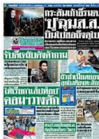
รูปที่ ๑.๔ รูปสื่อประเภทหนังสือพิมพ์

หนังสือพิมพ์ (Newspapers) เป็นสื่อสิ่งพิมพ์ที่ผลิตขึ้นโดยนำเสนอเรื่องราวข่าวสารภาพ และความคิดเห็น ในลักษณะของแผ่นพิมพ์ แผ่นใหญ่ ที่ใช้วิธีการพับรวมกับ ซึ่งสื่อสิ่งพิมพ์ชนิดนี้ได้พิมพ์ออก เผยแพร่ทั้งลักษณะหนังสือพิมพ์รายวัน รายสัปดาห์ และรายเดือน