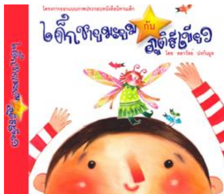
รูปที่ ๑.๑ รูปภาพสิ่งพิมพ์ประเภท ๒ มิติ

ในปัจจุบันสามารถแบ่งประเภทของสิ่งพิมพ์ได้มากมายหลายประเภท โดยทั้งสิ่งพิมพ์ ๒ มิติ และสิ่งพิมพ์ ๓ มิติ คือ สิ่งพิมพ์ที่มีลักษณะเป็นแผ่นเรียบ ใช้วัสดุจำพวกกระดาษและมีเป้าหมายเพื่อนำเสนอเนื้อหาข่าวสารต่าง ๆ เช่น หนังสือ นิตยสาร จุลสาร หนังสือพิมพ์ แผ่นพับ โบชัวร์ ใบปลิว นามบัตร แมกกาซีน ท์ ออกเก็ตบุ๊ก เป็นต้น