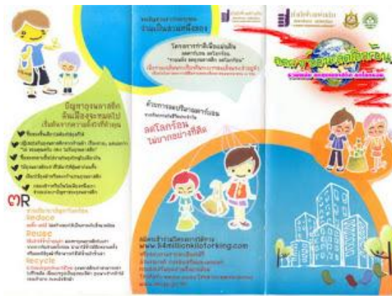
รูปที่ ๑.๘ รูปสื่อประเภทแผ่นพับ

๓) แผ่นพับ (Folder) เป็นสื่อสิ่งพิมพ์ที่เน้นการผลิตโดยเน้นการเสนอเนื้อหา ซึ่งเนื้อหาที่นำเสนอเป็นเนื้อหาที่สรุปใจความสำคัญ ลักษณะเป็นการพับเป็นรูปเล่มต่าง ๆ