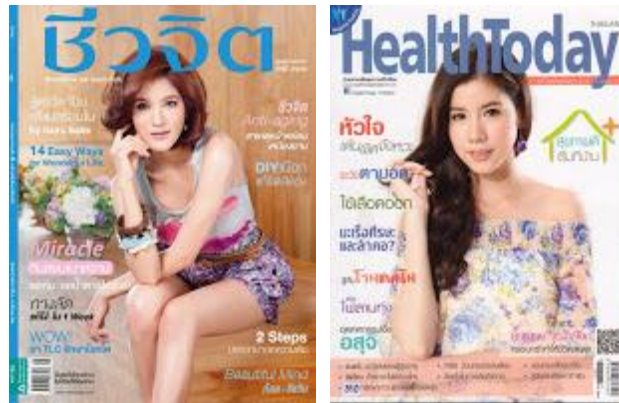
รูปที่ ๑.๕ รูปสื่อประเภทวารสาร นิตยสาร

เป็นสื่อสิ่งพิมพ์ที่ผลิตขึ้นโดยนำเสนอสาระข่าว ความบันเทิง ที่มีรูปแบบการนำเสนอ ที่โดดเด่น สะดุดตา และสร้างความสนใจให้กับผู้อ่าน ทั้งนี้การผลิตนั้น มีการกำหนดระยะเวลาการออกแบบเผยแพร่ที่แน่นอน ทั้งลักษณะวารสาร นิตยสารรายปักษ์ (๑๕ วัน) และรายเดือน จุลสาร เป็นสื่อสิ่งพิมพ์ที่ผลิตขึ้นแบบไม่มุ่งหวังผลกำไร เป็นแบบให้เปล่าโดยให้ผู้อ่านศึกษาหาความรู้ ที่กำหนดออกแบบเผยแพร่เป็นครั้ง ๆ หรือลำดับต่าง ๆ ในวาระพิเศษ