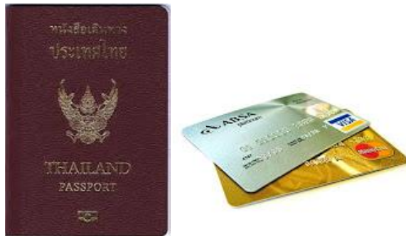
รูปที่ ๑.๑๑ รูปสื่อประเภทสิ่งพิมพ์มีค่า

๓.๖ สิ่งพิมพ์มีค่า เป็นสื่อสิ่งพิมพ์ที่เน้นการนำไปใช้เป็นหลักฐานสำคัญต่าง ๆ ซึ่งกำหนดตามกฎหมาย เช่น ธนาณัติ บัตรเครดิต เช็คราคาบัตร ตัวแลกเงิน หนังสือเดินทาง โฉนด เป็นต้น