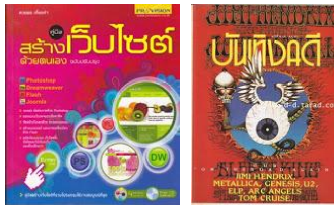
รูปที่ ๑.๓ รูปหนังสือบันเทิงคดี

๒) หนังสือบันเทิงคดี เป็นสื่อสิ่งพิมพ์ที่ผลิตขึ้นโดยใช้เรื่องราวสมมติ เพื่อให้ผู้อ่านได้รับความเพลิดเพลิน สนุกสนาน มักมีขนาดเล็ก เรียกว่า หนังสือฉบับกระเป๋า หรือ PocketBook ได้