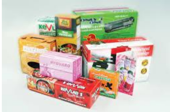
รูปที่ ๑.๑๐ รูปสื่อประเภทสิ่งพิมพ์เพื่อการบรรจุภัณฑ์

เป็นสิ่งพิมพ์ที่ใช้ในการห่อหุ้มผลิตภัณฑ์การค้าต่าง ๆ แยกเป็นสิ่งพิมพ์หลัก ได้แก่สิ่งพิมพ์ที่ใช้ปิดรอบขวด หรือกระป๋องผลิตภัณฑ์การค้า สิ่งพิมพ์รอง ได้แก่ สิ่งพิมพ์ที่เป็นกล่องบรรจุหรือฉลาก