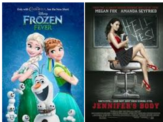
รูปที่ ๑.๙ รูปสื่อประเภทใบปิด

๔) ใบปิด (Poster) เป็นสื่อสิ่งพิมพ์โฆษณา โดยใช้ปิดตามสถานที่ต่าง ๆ มีขนาดใหญ่เป็นพิเศษซึ่งเน้นการนำเสนออย่างโดดเด่นดึงดูดความสนใจ