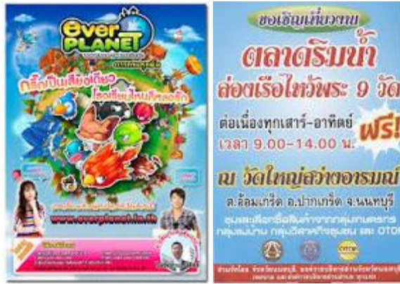
รูปที่ ๑.๗ รูปสื่อประเภทใบปลิว

๓) แผ่นพับ (Folder) เป็นสื่อสิ่งพิมพ์ที่เน้นการผลิตโดยเน้นการเสนอเนื้อหา ซึ่งเนื้อหาที่นำเสนอเป็นเนื้อหาที่สรุปใจความสำคัญ ลักษณะเป็นการพับเป็นรูปเล่มต่าง ๆ