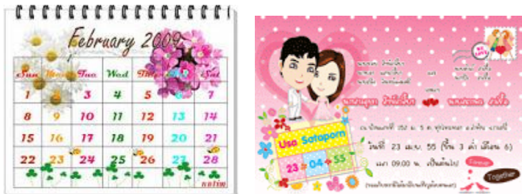
รูปที่ ๑.๑๒ รูปสื่อประเภทสิ่งพิมพ์ลักษณะพิเศษ

๓.๗ สิ่งพิมพ์ลักษณะพิเศษ เป็นสื่อสิ่งพิมพ์ที่มีการผลิตขึ้นตามลักษณะพิเศษแล้วแต่การใช้งาน ได้แก่นามบัตร บัตรอวยพร ปฏิทิน ใบส่งของ ใบเสร็จรับเงิน สิ่งพิมพ์บนแก้ว สิ่งพิมพ์บนผ้า เป็นต้น