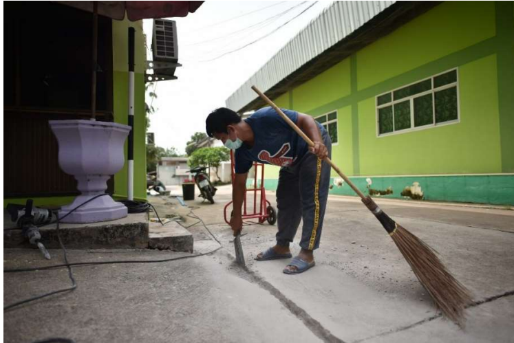
ปรับปรุงระบบน้ำปะปาเพื่อไว้บริการตามอาคารเรียนให้พร้อมใช้งานได้ตลอดเวลา