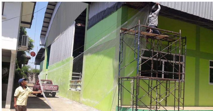
ซ่อมตาข่ายกันนกฟิราบในโรงอาหารโรงเรียน