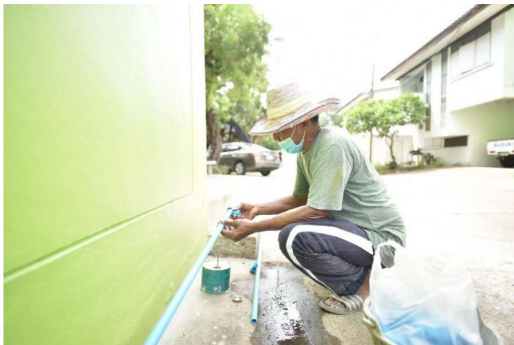
ซ่อมบำรุงระบบน้ำภายในโรงเรียน