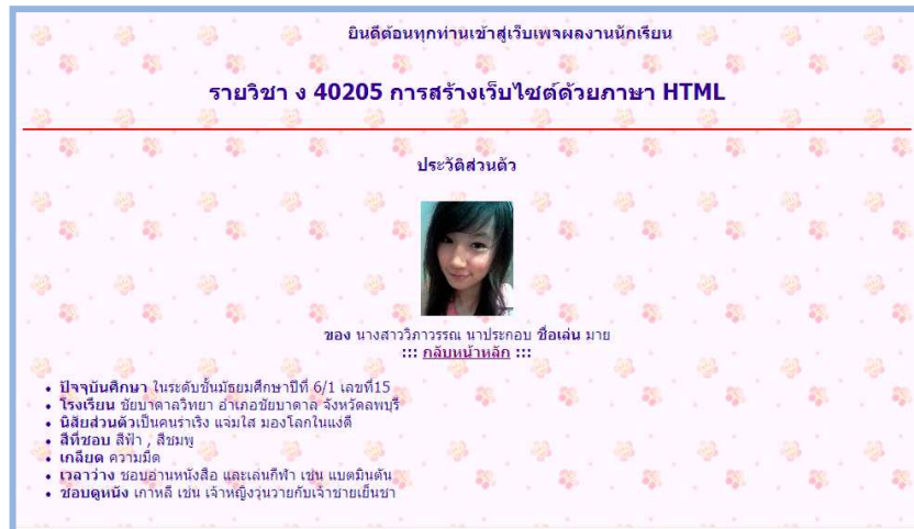
ตัวอย่างไฟล์ P101.html